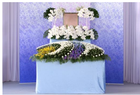
花祭壇 B タイプの場合