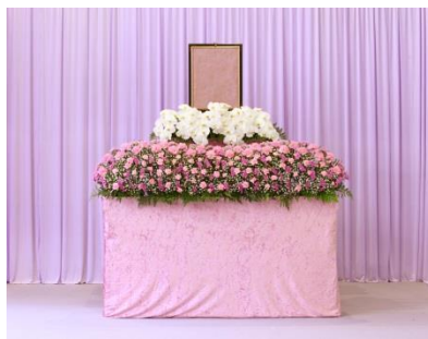
花祭壇 A タイプの場合